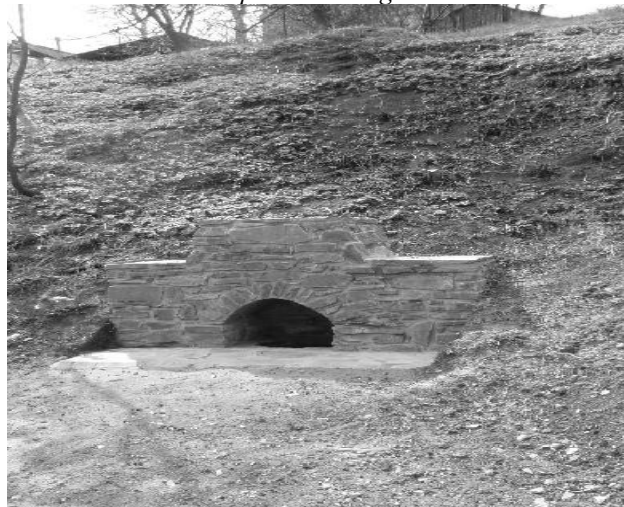
Proměna Nebovidské studánky na žádost Klubu Beseda